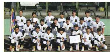
中学校の部 優勝 長嶺中学校

第一試合：二岡 6-4 東部・西原 優勝：長嶺中学校 第一試合：長嶺 2-2 東部・西原 準優勝：二岡中学校 第二試合：長嶺 11-1 二岡 3位：東部・西原 中学校 (合同チーム)