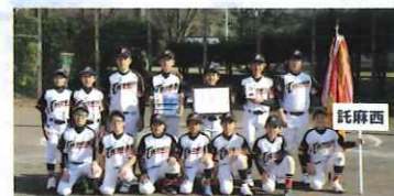
小学校の部 優勝 託麻西小学校

第一試合：長嶺 9-7 託麻東 優勝：託麻西小学校 第一試合：託麻西 11-0 託麻南 準優勝：長嶺小学校 第二試合：長嶺 9-6 託麻北 3位：託麻南小学校 第二試合：託麻西 13-1 託麻東 4位：託麻東小学校 第三試合：託麻南 14-5 託麻北 5位：託麻北小学校