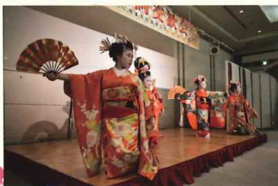
◎「舞踊団 花童&はつ喜」の皆さんによる 新春郷土の舞・新春の宴 言祝の舞

乾杯後、出席者は各テーブルの臨席者等と新年の挨拶や名刺交換を通して交流を深められ、盛会のうちに終了しました。