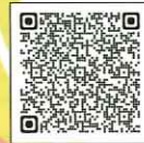
ふれんど共済制度パンフレット