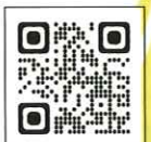
くまもとグットプロジェクトHP